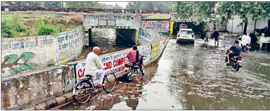
सोनीपत। शनि मंदिर अंडरब्रिज में भरा बरसात का पानी।

कई दिनों से लगातार गर्मी से परेशान लोगों को रविवार अल सुबह आई बारिश ने राहत दी, लेकिन इस राहत के साथ ही आसमान से बरसा पानी सड़कों और गलियों में आफत भी बन गया। मानसून से पहले ही तकरीबन पौने घंटे की बारिश ने शहर में नगर निगम के निकासी प्रबंधों के दावों की पोल खोल दी। शहर के प्रमुख चौक चौराहों से लेकर कई कॉलोनीयों में जलभराव की समस्या नजर आई। जलमग्न सड़कों से लोगों को आवागमन करने में काफी परेशानी का सामना करना पड़ा। लगभग दोपहर तक जल की निकासी संभव हो पाई। बता दें कि शहर में निकासी के पुख्ता प्रबंधों का दावा करने वाला नगर निगम अभी तक शहर के बीच से गुजर रही ड्रेन की सफाई को लेकर टेंडर भी अलॉट नहीं कर सका है। सोनीपत शहर में 25 एमएम बारिश दर्ज की गई। जिसके बाद शहर के शनि मंदिर अंडरपास और रेलवे अंडरब्रिज में करीब आधा फुट तक पानी भर गया, जिससे वाहन चालकों और राहगीरों को खासी परेशानी का सामना करना पड़ा। इसके साथ ही सरदारों वाली गली, सेक्टर-15, मामचंद कॉलोनी, बहालगढ़ रोड, जीटी रोड पर राई के पास सहित कई इलाकों में गलियों में जलभराव हो गया। स्थानीय निवासियों को घरों से बाहर निकलने में दिक्कत हुई।