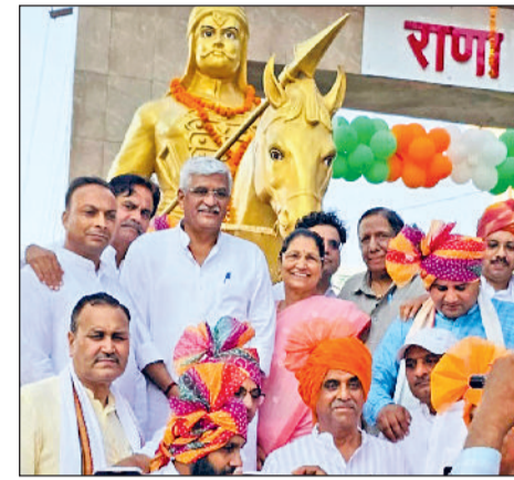
राई। केंद्रीय मंत्री गजेन्द्र सिंह शेखावत व विधायक वीर शिरोमणि महाराणा प्रताप की भव्य प्रतिमा का अनावरण करते हुए।