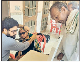
गोहाना। शिविर में एक महिला के कानों की जांच की जांच करते हुए विशेषज्ञ।