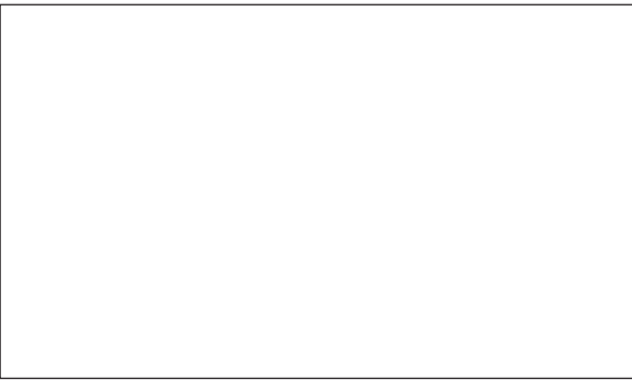
सोनीपत। विकास कार्य का शुभारंभ करते हुए विधायक, मेयर एवं अन्य।