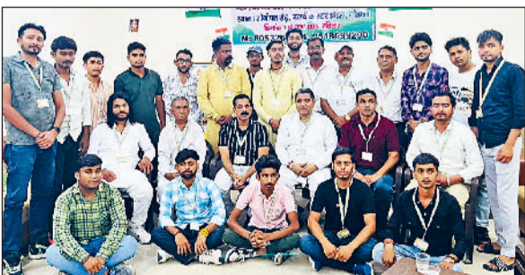
गोहाना। समारोह में उपस्थित संगठन के कार्यकर्ता।