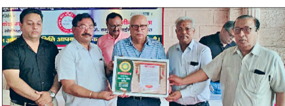
सोनीपत। गणमान्य लोगों को सम्मानित करते हुए प्रधान एवं अन्य पदाधिकारी।