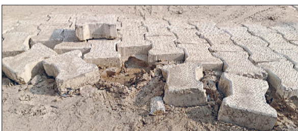
गन्नीर। गली की उखड़ी हुई टाइलें।

शहर में नगरपालिका द्वारा विभिन्न वार्डों में गली निर्माण कार्य कराए जा रहे हैं। हालांकि नगरपालिका अधिकारी इन निर्माण कार्यों को गुणवत्तापूर्ण बताते हुए विकास के बड़े-बड़े दावे कर रहे हैं, लेकिन कई जगहों पर यह दावे फेल हो रहे हैं। खेड़ी रोड स्थित कौशिक गार्डन के पास हाल ही में बनाई जा रही एक गली ने नगरपालिका के विकास कार्यों की पोल खोलकर रख दी है। स्थानीय निवासियों ने आरोप लगाया है कि गली निर्माण में ठेकेदार द्वारा घटिया सामग्री का प्रयोग किया जा रहा है। बताया गया कि टाइलें बिछाने से पहले जहां मजबूत आधार के लिए पत्थर व आवश्यक सामग्री डाली जानी चाहिए थी, वहां सीधी कच्ची मिट्टी को समतल कर