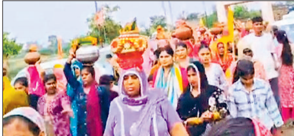
गन्नौर। श्रीमद् भागवत कथा ज्ञान सप्ताह यज्ञ की शुरुआत में कलश यात्रा निकालते हुए।