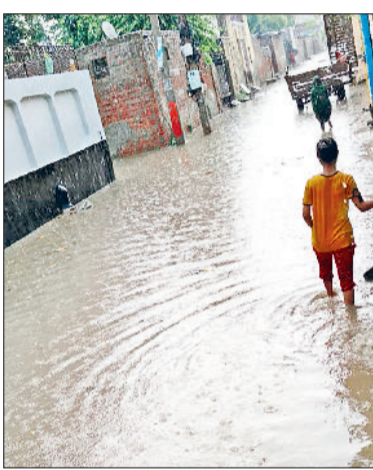
सोनीपत। मामचंद कॉलोनी में जलभराव।