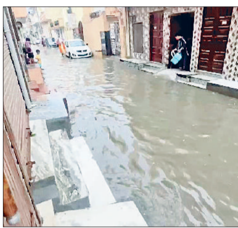
सोनीपत। सरदारों वाली गली की हालत।