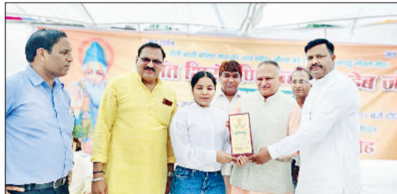
सोनीपत। कार्यक्रम के दौरान मेधावी छात्रा को सम्मानित करते मेयर साथ में अन्य।